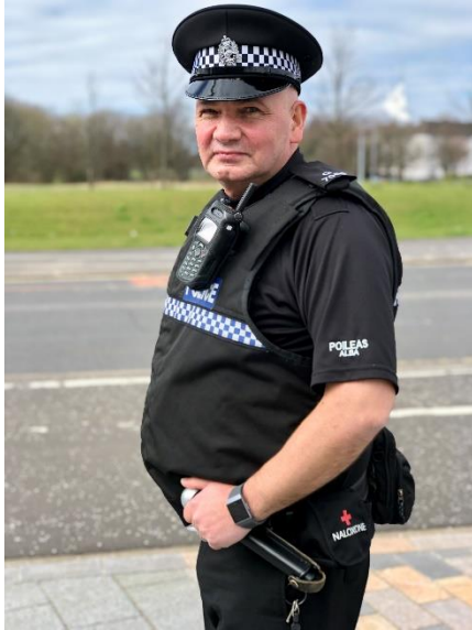
Oifigear Poileas Alba a' giùlan Naloxone

Fhuair Comataidh Cùisean Albannach Taigh nan Cumantan fianais a bha a' làn-dhearbhadh nach robh anns an dòigh-dhèiligidh an-dràsta, sa bheil drogaichean gam meas na chùis eucoir ach dòigh-dhèiligidh gu tur neo-thairbheach 11 . Seach sin, mhol mòran dhaoine gum bu chòir Alba a bhith deònach fuasglaidhean innleachdach stèidhichte air fianais a chur an gnìomh airson dèiligidh ri mì-chleachdadh dhrogaichean 12 .