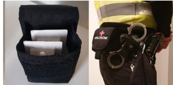
Dòigh-ghiùlain Naloxone le oifigearan Poileas Alba

am beatha a shàbhaladh. Leigidh am pìolat seo le Poileas Alba measadh iomlan a dhèanamh air dè an tairbhe a dh'fhaodadh a bhith an lùib oifigearan sràide acainneachadh le Naloxone.