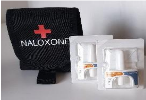
Acainn steallaire-sròine Naloxone

An lorg seo, ghairm Poileas Alba Buidheann-stiùiridh Lìbhrigeadh Naloxone air 12 Màrt 2020. Tha am Buidheann ag amas air freagairt dhìreach ris a' mheudachadh ann an taran-dhòs clàraichte de dhrogaichean opioid agus tuigse fhaighinn air na buannachdan coimhearsnachd nuair a bhios Naloxone ga ghiùlan air an t-sràid le oifigearan-poileis.