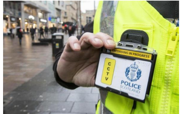
Deuchainn BWV ann an Roinn an Ear-thuath

'S e Camara-bodhaig (BWV) uidheam as urrainnear cur ort agus fuaim is bhideo a chlàradh. Tha uidheaman BWV ri fhaighinn ann an diofar dhreachan fiosaigeach is teicnigeach, ach aig a' cheann thall, tha na h-aon bun-fhoinceanan orra le chèile. Thathar ga chosg thairis air a' bhroilleach no air muin clogaid ann am bitheantas.