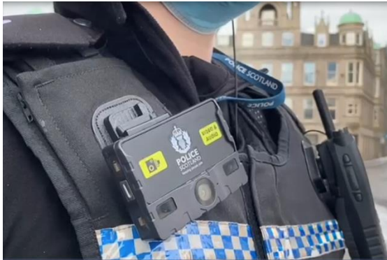
Oifigear Poileas Alba a' giùlan BWV

Tha BWV ga chleachdadh an-dràsta gu ìre bheag le Poileas Alba, mar as trice ann an ceann an ear-thuath na dùthcha. Tha Oifigearan Poileis agus Constabalan Speisealta à Roinn an Ear-thuath air BWV a chleachdadh bhon Ògmhios 2010. Thòisich seo mar dheuchainn piolait airson cleachdadh BWV ann an sgìre ainmichte fo dhìleab Grampian Police.